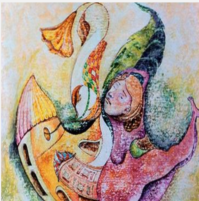
La notte di San Giovanni, 1985